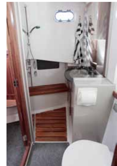
Keulahytin yhteydessä oleva toiletti on väljä ja jaettu pesu- ja wc-tilaan. Toisen hytin yhteyteen saa myös wc:n.