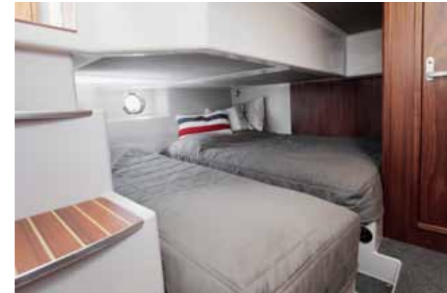
Taaempi makuuhuytin sijaitsee keskellä venettä. Vuodepaikkoja on kolme.