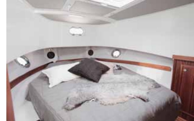
Keulan makuuhuytin on iso ja kattoluukku tuo valoa ja avaruutta.

36-jalkaisen Minorin sisätilat ovat kauttaaltaan väljät ja toimivat. Vakiona oleva pähkinäpuu tuo lämpimän kontrastin muutoin harmaisiin ja vaaleisiin pintoihin. Veneen tilaratkaisut ovat vakioituneet, eikä tilojen varioimiseen ole siten mahdollisuutta.