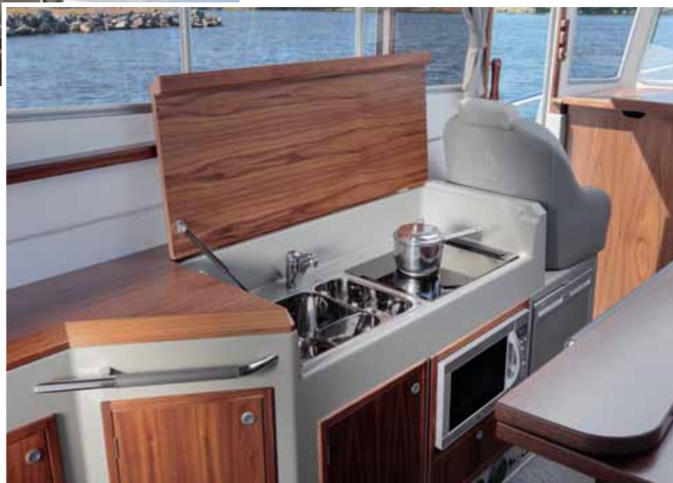
Hyvin varusteltu pentteri löytyy salonkia vastapäätä vasemmalta laidalta. Liesi ja altaat on sijoitettu vierekkäin avattavan tason alle. Ratkaisu on siisti, sillä toiminnot saa piiloon kannen alla. Laskutilaa on kuitenkin niukalti.

Sen sijaan sisätilojen värimaailmaan asiakkaalla on halutessaan mahdollisuus vaikuttaa.